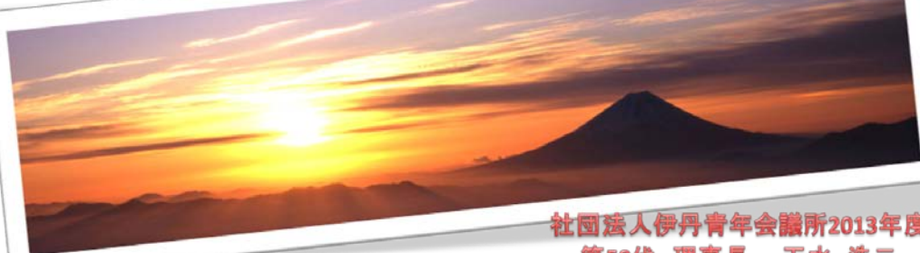
社団法人伊丹青年会議所2013年度 第50代 理事長 玉水 浩二